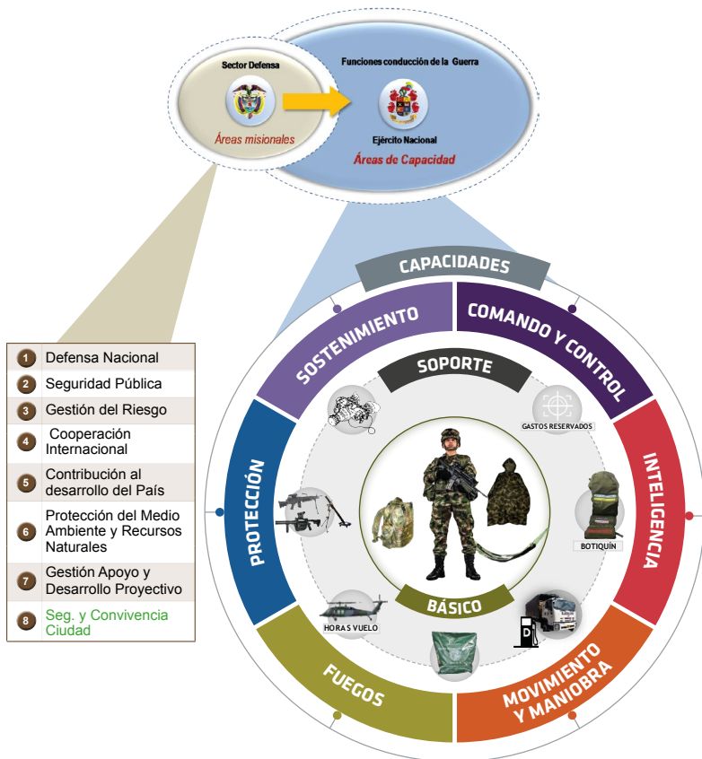
Figura No. 2 “Soldado Básico”