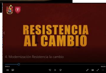
Video N° 4, Herramientas de gestión del cambio "RESISTENCIA AL CAMBIO".