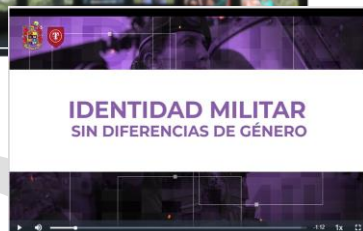
Video N° 5, IDENTIDAD MILITAR.