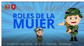
Video N° 1, UN EJÉRCITO MÁS FUERTE "GENERO - DOCTRINA - TECNOLOGÍA".

https://mindefensa.primo.exlibrisgroup.com/permalink/57MDN_INST/19u7a5o/alma991214494707231