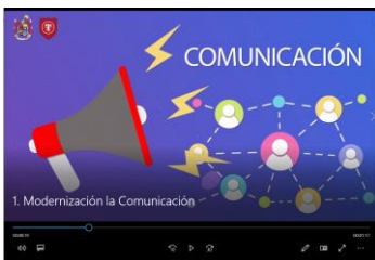
Video N° 1, Herramientas de gestión del cambio "LA COMUNICACIÓN".

https://mindefensa.primo.exlibrisgroup.com/permalink/57MDN_INST/19u7a5o/alma991211588907231