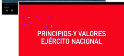
Video N° 2, PRINCIPIOS Y VALORES.