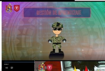
Video N° 2, Herramientas de gestión del cambio "GESTIÓN DEL APRENDIZAJE".