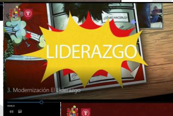
Video N° 3, Herramientas de gestión del cambio "EL LIDERAZGO".