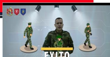
Video N° 3, DOCTRINA.