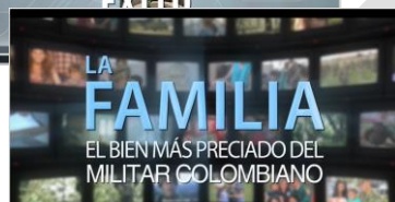
Video N° 4, FAMILIA.