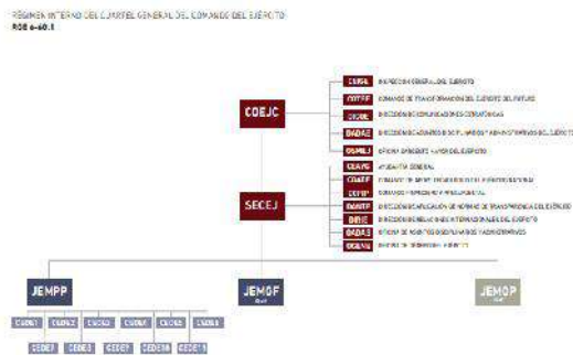
Figura 1-1 | Organización del Cuartel General del Comando del Ejército

Corolario de lo anterior, es de precisar que el Concepto emitido en el mes de marzo de 2022, por el Departamento de Operaciones del Ejército (CEDE3), obedeció a una solicitud elevada por la Dirección de Asuntos Disciplinarios y Administrativos del Ejército Nacional, previo a la emisión del Reglamento de Régimen Interno, con el que claramente se decantó y solucionó la ambigüedad sobre la organización del Cuartel General del Ejército, permitiendo de esta manera concluir diáfananamente y sin lugar a equívocos, la aplicación de las competencias de lo señalado en el artículo 102 de la Ley 1862 de 2017 6 , entendiendo qué dependencias de la organización corresponden al Cuartel General del Ejército, así: